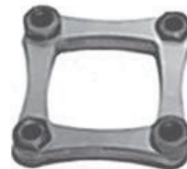
Муфта вспомогательного насоса гидравлики A9807-Л21