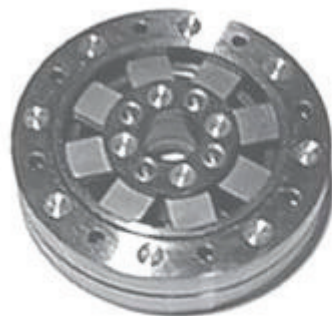
Муфта основного насоса гидравлики