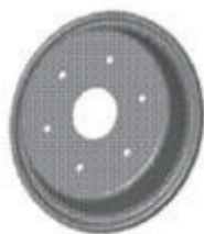
Мембрана регулятора давления на ГТК A 7507-Л33