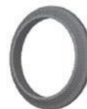
Манжета силовой трубы A 7507-Л39