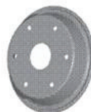
Мембрана регулятора давления на Ruston A 7507-Л34